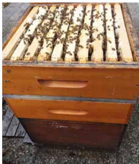
Die Bienen folgen dem Königinpheromon und gehen nach unten. Am nächsten Tag sind die Honigräume leer und können geerntet werden.