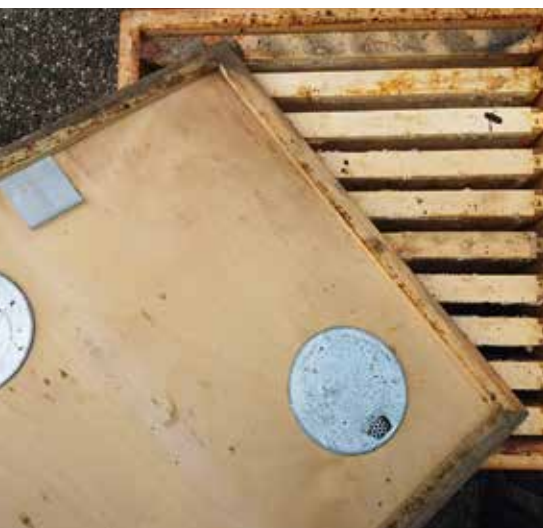
Zum Abfluchten wird ein leerer Honigräum untergesetzt, dann kommt die Bienenflucht und dann die vollen Honigräume.

chen Milben, die in die Drohnenbrut gegangen wären, in die Arbeiterinnenbrut. Die Erfahrungen der letzten Jahre zeigen, dass eine Milbenbekämpfung Mitte Juli sehr notwendig erscheint, um noch ausreichend stark einzuwintern. Ich will Ihnen hier nicht noch ein Varroabehandlungskonzept darlegen, denn das kommt jedes Jahr wieder, in jeder Imkerzeitung und in jeder Vereinsversammlung. Ich benutze seit vielen Jahren keine Ameisensäure mehr, weil mir das Aufheulen der Bienen beim Applizieren der Säure und die relativ hohen Königinnenverluste während der Behandlung nicht mehr gefallen haben. Ich sehe, dass die Brut schwarz wird, um dann später von den Bienen ausgeräumt zu werden. Das passiert auch, wenn man ApiLife VAR direkt auf das Brutnest legt. Die Bienen ziehen sich mehr als 10 cm von den Wirkstoffplättchen zurück, die Brut kühlt aus und nach einigen Tagen wird die Brut ausgeräumt. Diese Beobachtungen führten mich zu der Erkenntnis, dass eine gezielte totale Brutentnahme zwischen dem 15. und 30. Juli die schnellste und wirkungsvollste Methode ist, das Bienenvolk zu entmilben. Sicher mag mancher einwenden, dass durch die völlige Entnahme (und das Einschmelzen) der alten, parasitierten Brutwaben, auch viele Bienen verlorengehen, die nicht parasitiert sind. Ich halte dem entgegen, dass die sofortige Entmilbung durch die Brutentnahme (auch der offenen Waben) und einer Oxalsäurebehandlung durch Besprühen oder Träufeln eine fast 100-prozentige Milbenfreiheit ga-