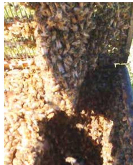
Im Ruheraum ketten sich die Bienen am Absperrgitter auf. Es entsteht kein Wildbau.